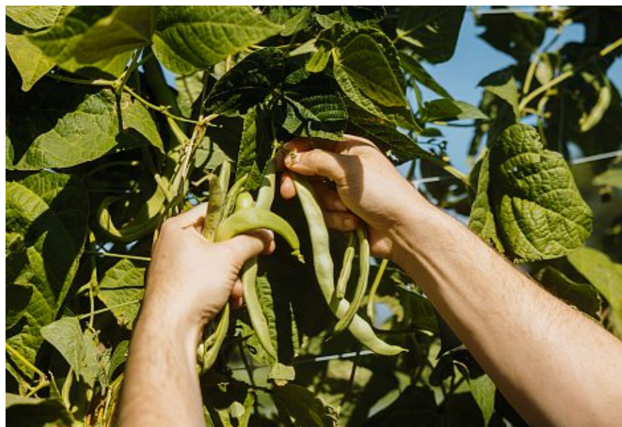
Kein Fleisch, nur Gemüse: Das Einfachste erweist sich als hochkomplex.