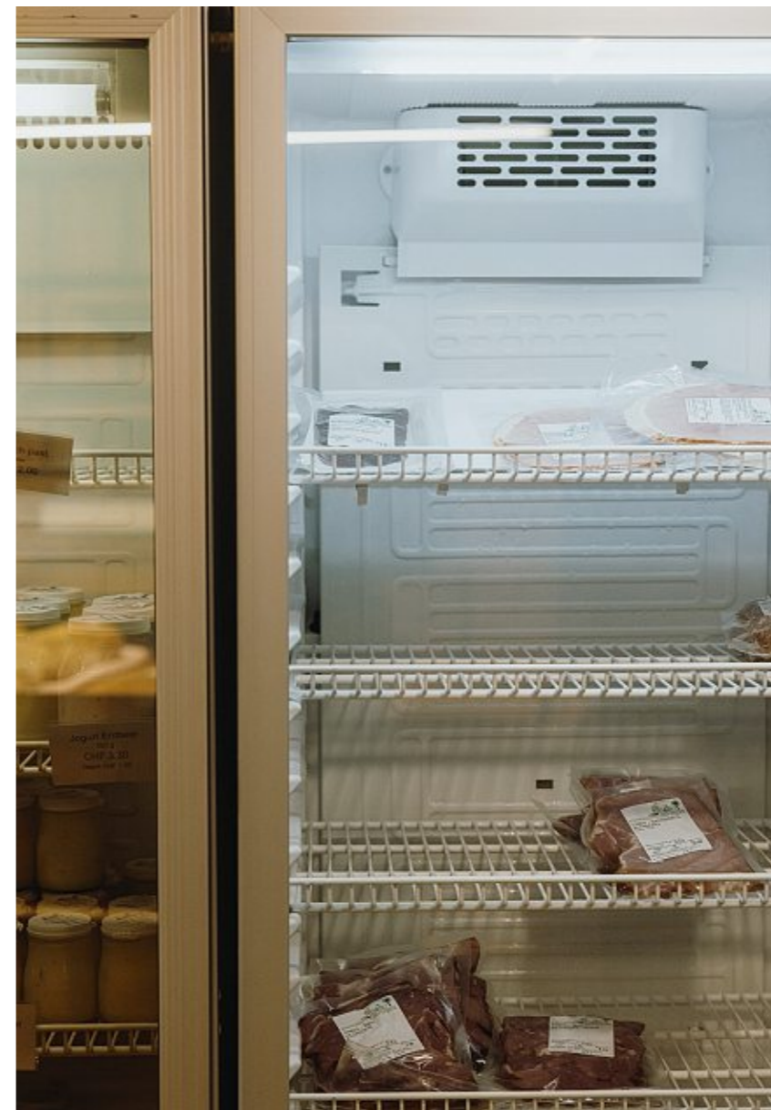
Leere Kühltheke, neues Geschäftsmodell: Die Burrens werden kein Fleisch mehr verkaufen. Sie arbeiten künftig postletal.

In der Landwirtschaft tätige Journalistinnen und Wissenschaftler, mit denen ich mich unterhalte, sagen mir, dass die Angst, es sich mit den Landwirt:innen und der Bauernlobby im Bundeshaus zu verschern, nicht unbegründet sei. Agroscope ist dem Bundesamt für Landwirtschaft unterstellt, wird pro Jahr mit Bundesgeldern von rund 170 Millionen Franken finanziert. Die Branche beobachtet genau, womit sich ihr Forschungsinstitut befasst. Sprüche Agroscope zu ausführlich oder zu positiv über vegane Landwirtschaft, würden sich viele wundern: Was hat das mit der Realität zu tun? Fast 90 Prozent der Schweizer Landwirtschaftsfläche wird von der Nutztierhaltung beansprucht, zwei von drei Landwirtschaftsbetrieben